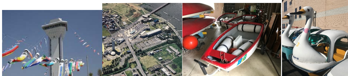
* 鯉のぼりが皆をお迎え * ふれあいランド全貌 * レンタル OP 艇 * スワンボート