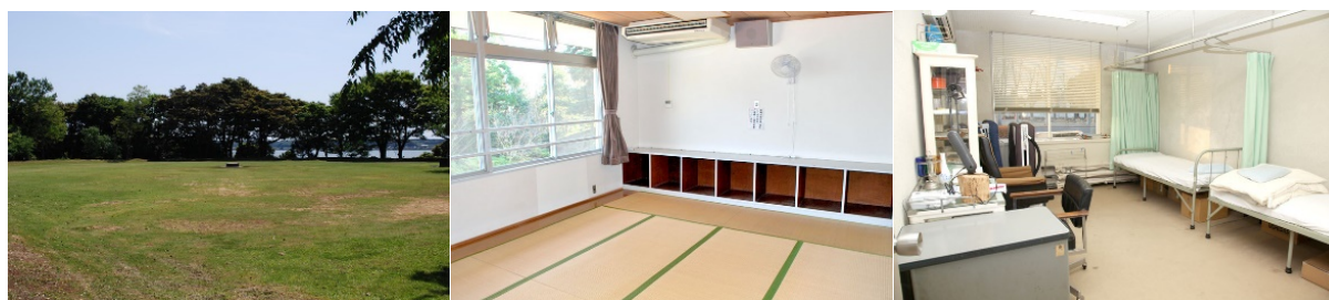
* 中庭 (遊べる) * 和室 (きれい) * 保健室 (安心♡)