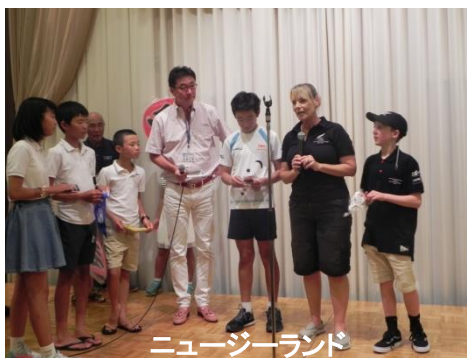
ニュージーランド