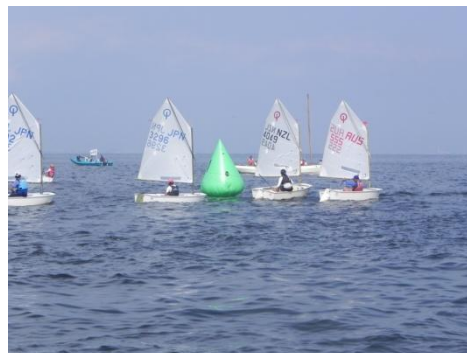
OP級上級者のレース