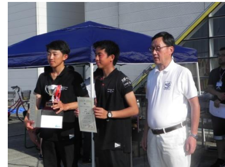
東京ヨット連盟会長賞