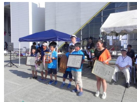
文部科学大臣賞・国土交通大臣賞・東京都知事賞