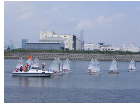
OP級初級者のレース